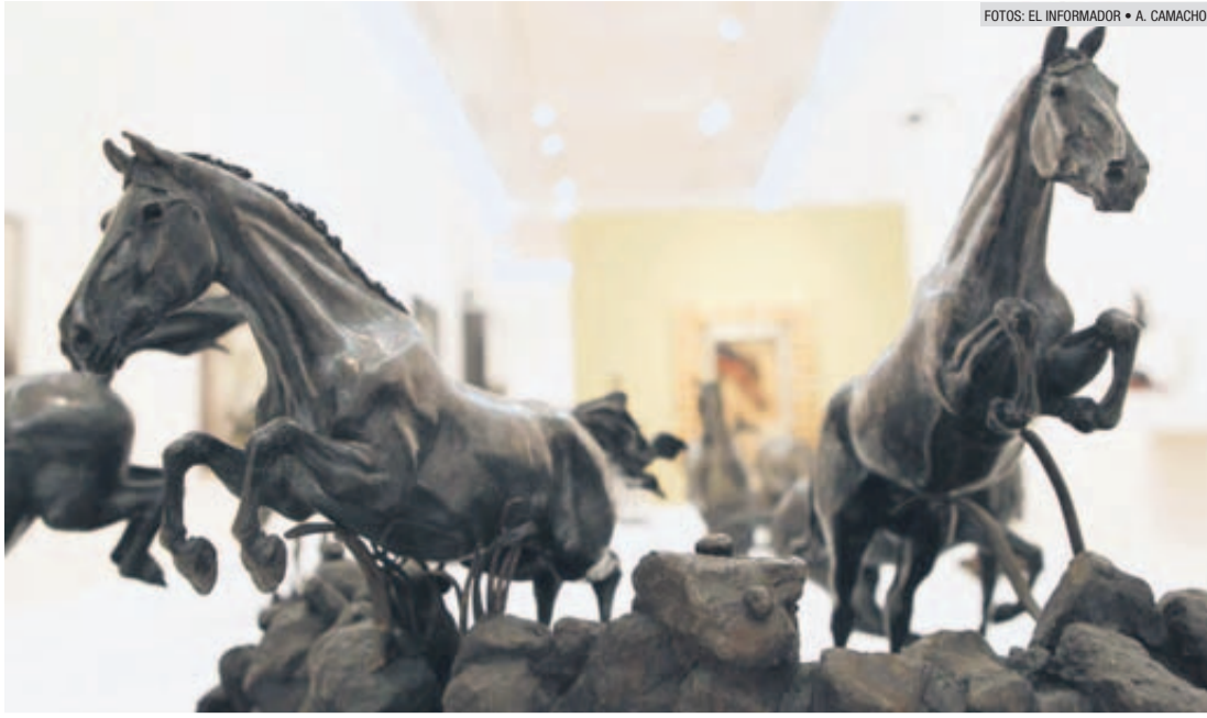
SALTOS HACIA AFUERA. Obra de Diego Martínez Negrete.