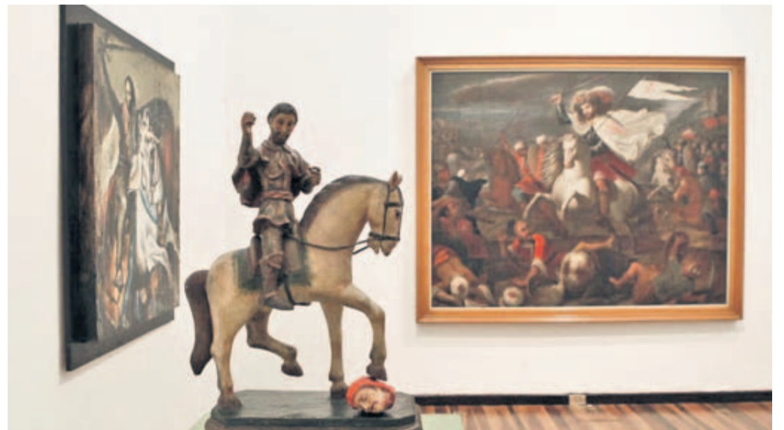
SANTO SANTIAGO. Estáfoto en madera del Siglo XVII, el autor es anónimo.