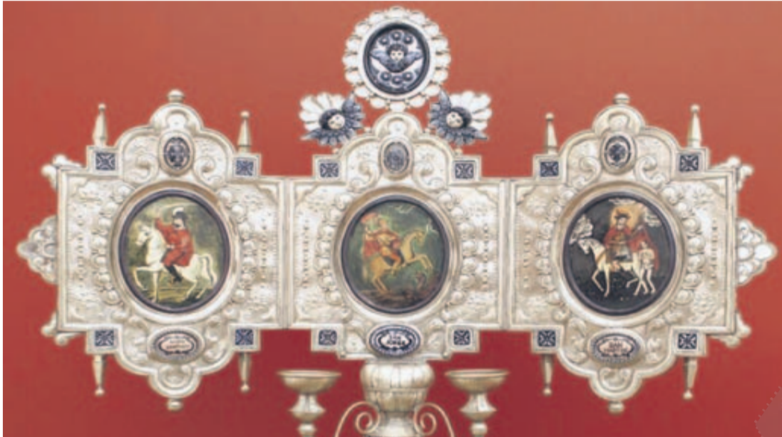
CANDELABRO. Obra de Jesús Guerrero Santos: incluye a Santo Santiago, San Martín y San Jorge.