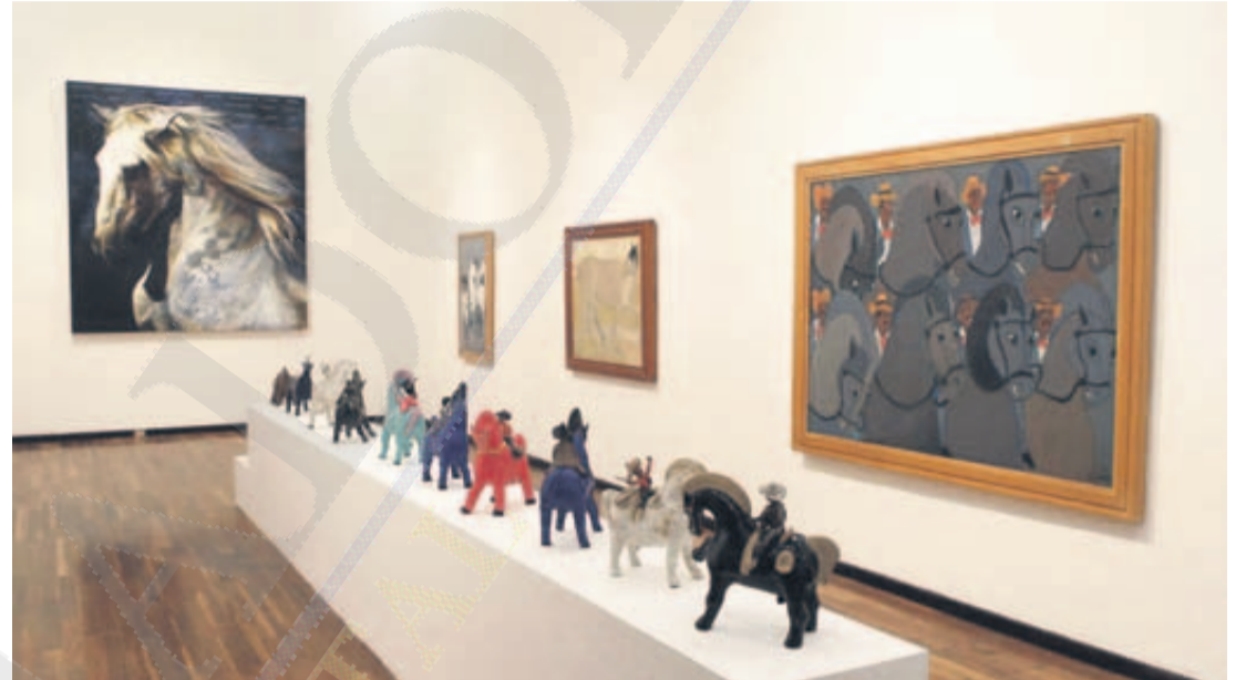
ESCULTURAS. Los caballos y los cuadros a sus espaldas son obra de Marco Aldaco; la pintura al fondo es de Waldo Saavedra.